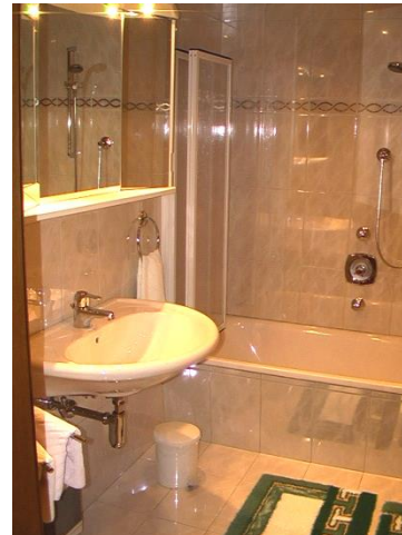
BADEZIMMER mit WC: Badewanne mit Duschorruchtung