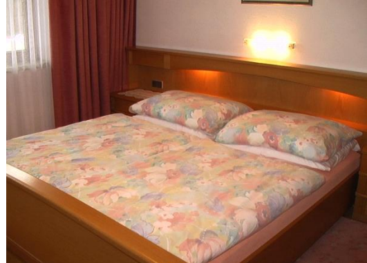
SCHLAFZIMMER mit hochwertigen Matratzen und verstellbarem Lattenrost