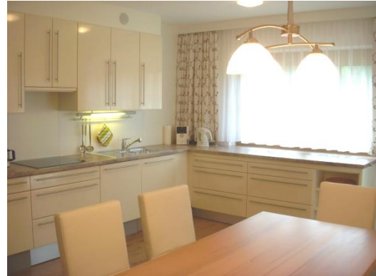
WOHNKÜCHE: komplett eingerichtet mit Geschirrspüler, Toaster, Kaffeemaschine, Geschirr, Stereoanlage