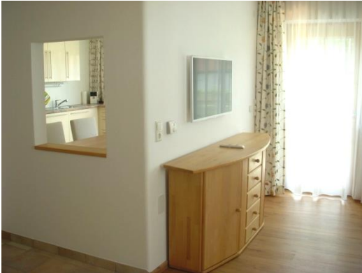
WOHNZIMMER mit Blick in Wohnküche

Die Ferienwohnung 90 m 2 ist neu eingerichtet: