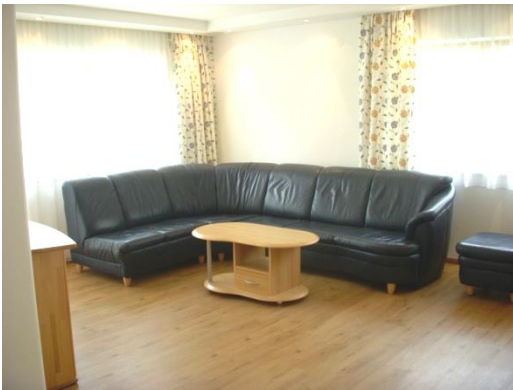
WOHNZIMMER mit SAT-TV, neuer Flat-Bildschirm und Stereoanlage