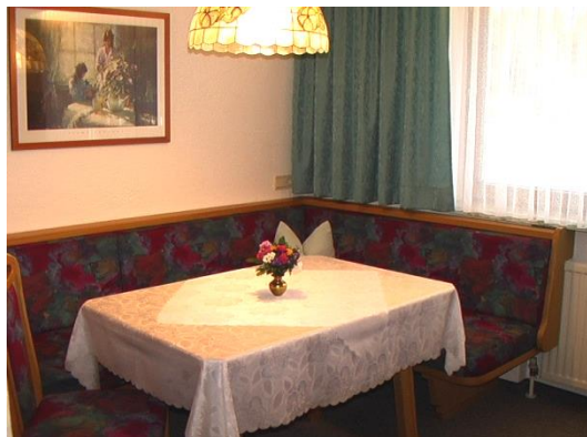
SITZECKE im Wohnschlafzimmer