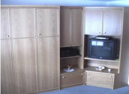
WOHNSCHLAFZIMMER: Schrank-Doppelbett für 2 Personen, jetzt neuer Flat-TV mit SAT-Empfänger, Stereo-Anlage

Die Ferienwohnung 50 m 2 ist komfortabel eingerichtet: