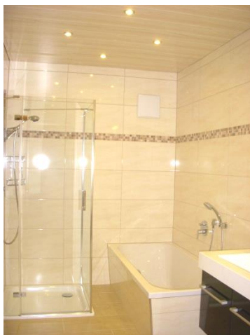
BADEZIMMER mit Badewanne, Dusche und Doppelwaschtisch