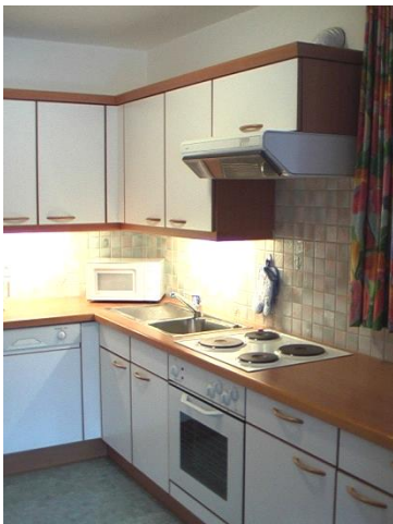
KÜCHE: Geschirrspüler, Kaffeemaschine, Mikrowellenherd, Toaster, Kühlschrank, Bestecke, Geschirr usw.