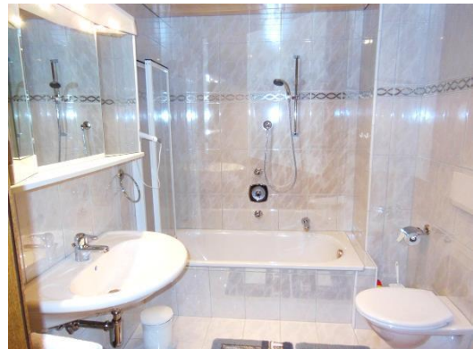
BADEZIMMER mit WC: Badewanne mit Duscheinrichtung