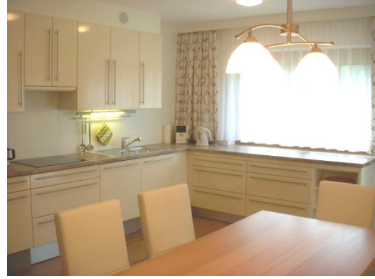
WOHNKÜCHE: komplett eingerichtet mit Geschirrspüler, Toaster, Kaffeemaschine, Geschirr, Stereoanlage