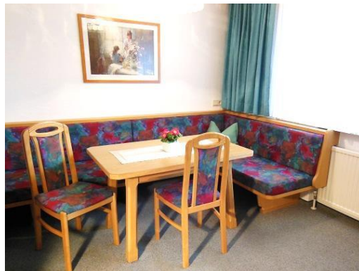
SITZECKE im Wohnschlafzimmer