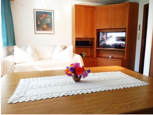
WOHNSCHLAFZIMMER: Schlaf-Sofa für 2 Personen, LCD-TV mit SAT-Empfänger, Stereo-Anlage

Die Ferienwohnung 50 m 2 ist komfortabel eingerichtet: