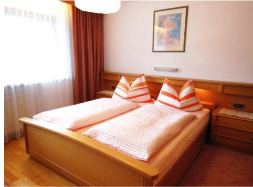
SCHLAFZIMMER mit hochwertigen Matratzen und verstellbarem Lattenrost