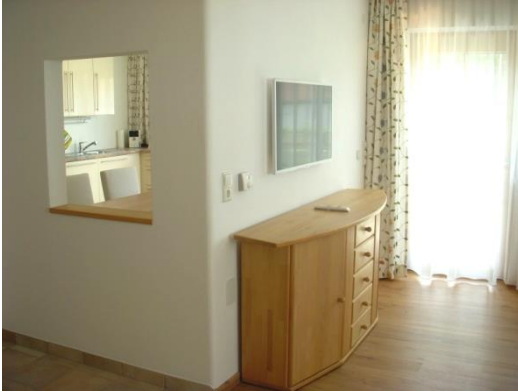
WOHNZIMMER mit Blick in Wohnküche

Die Ferienwohnung 90 m 2 ist neu eingerichtet: