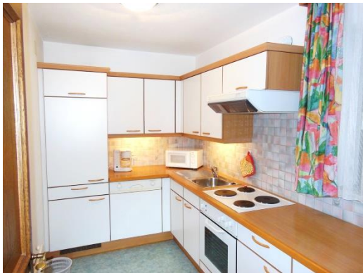
KÜCHE: Geschirrspüler, Kaffeemaschine, Mikrowellenherd, Toaster, Kühlschrank, Bestecke, Geschirr usw.